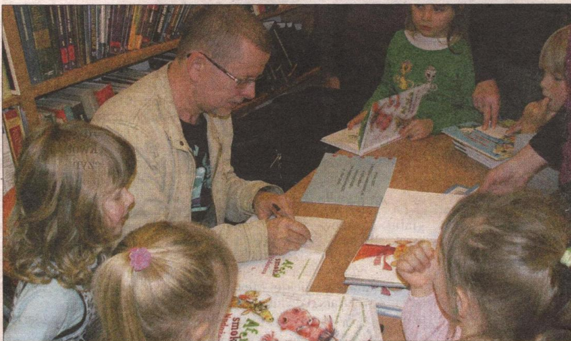
Na finał spotkania w Niepołomicach Andrzej Grabowski rozdał mnóstwo autografów